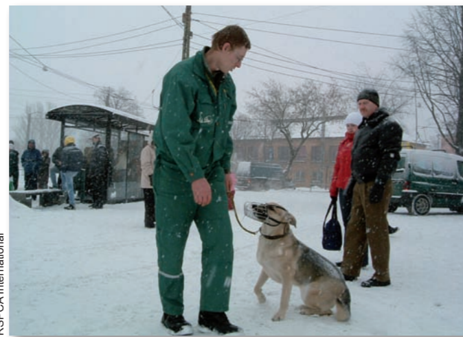
▲ Humane animal handling workshop for municipal staff in Portugal.