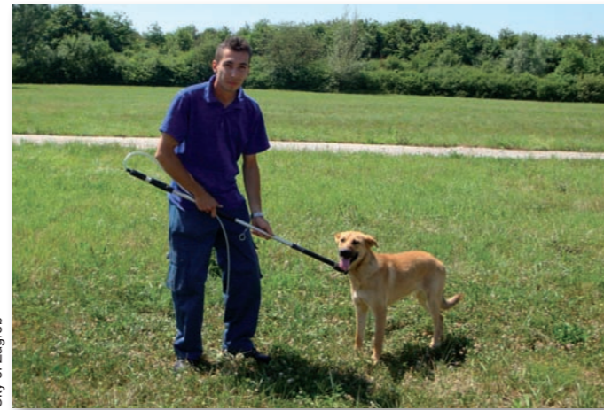
City of Zagreb

Caution should be used when placing a grasper around the dog's head. Although many socialised dogs, which are used to a restraint around the neck, adapt readily to a grasper, many unsocialised or nervous dogs struggle quite violently. Many dogs bite the pole or the wire, causing injuries to their gums, tongue or mouth and there is considerable risk of causing a tracheal fracture. Most importantly, staff should not overtighten the noose as they could easily strangle the dog. If the tongue of the dog begins to turn blue in colour then the noose is too tight and should be loosened immediately.