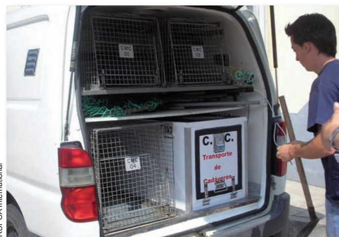
▲ An animal collection vehicle in Coimbra, Portugal.

Transportation time should be factored into the daily working schedule of catching staff. The longer they spend transporting dogs from place of capture to the holding facility, the less time they have for actually catching dogs. Take into account normal traffic congestion and avoid transporting dogs when a high volume of traffic is anticipated.