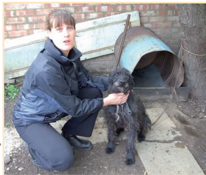
London Borough of Brent